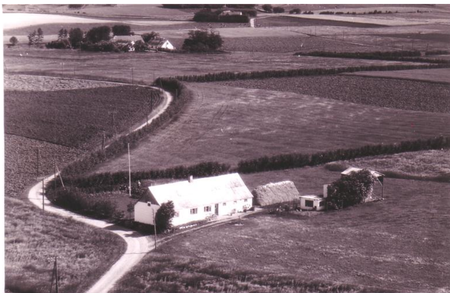
Hjemmet på Harrildvej i Byrsted, formodentlig i 1950-erne

Indtægterne suppleredes ved biavl i stor målestok. Et år solgte de over 3000 pund honning. Den første, kløverhonningen, blev solgt til Nibe apotek. Resten blev solgt rundt om på gårdene i en jumbe med en russerhest forspændt. Hesten blev kaldt russer, fordi den som så mange heste andre dengang var importeret fra Rusland. Der blev også lavet mjød, som de solgte. Da farfar fyldte 70 år d. 20. januar 1940 var der følgende omtale i avisen: