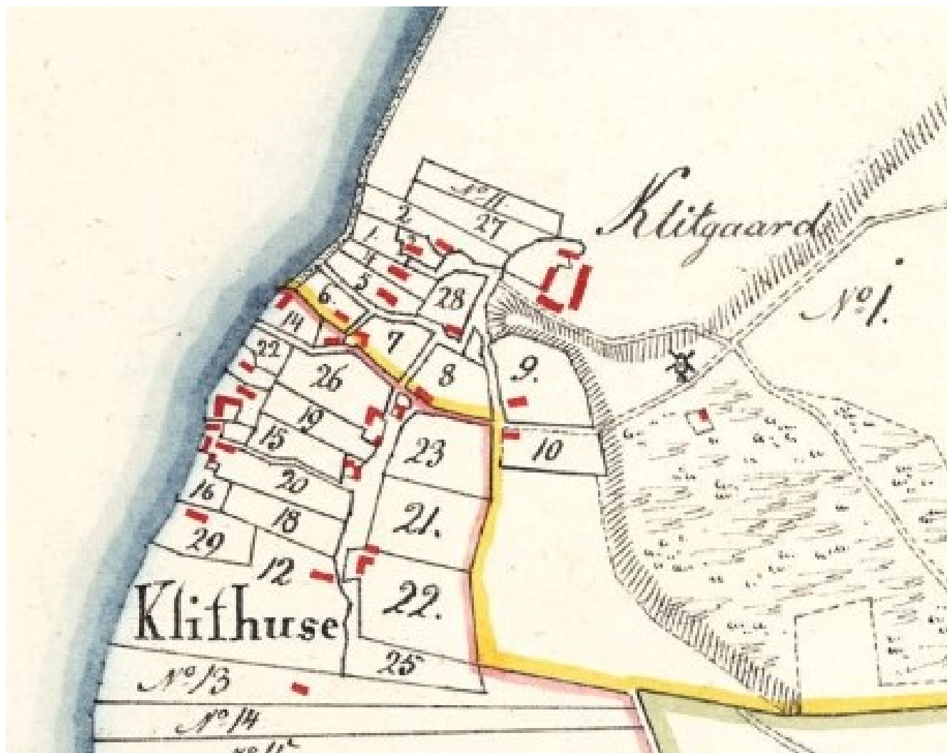
Klitgård, udsnit af Formindret sognekort.