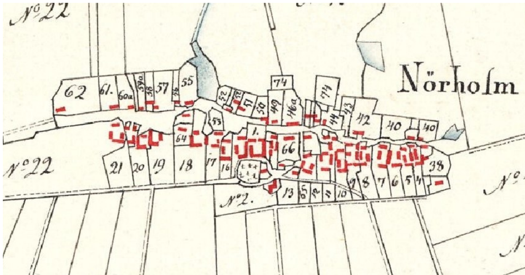
Nørholm, udsnit af Formindret sognekort.