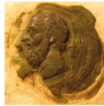
Peder Judes segl 1556