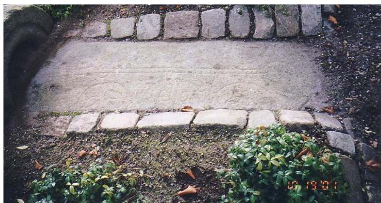
Stenen på kirkegården