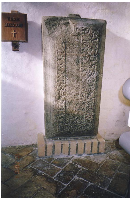
Stenen i våbenhuset